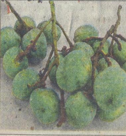
प्रदर्शनी में सजे विभिन्न प्रजातियों के आम।